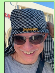
Stéphane Michettoni Logistique