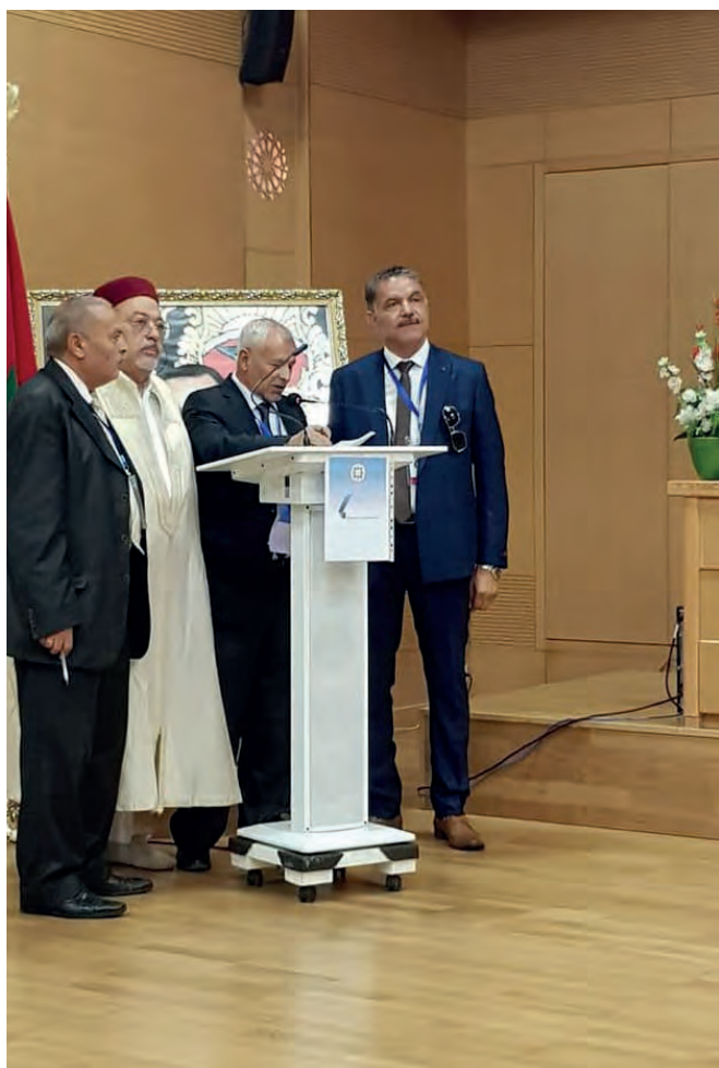
La délégation tunisienne

Organisation et mise en place de 3 tables rondes sur les thèmes suivants :