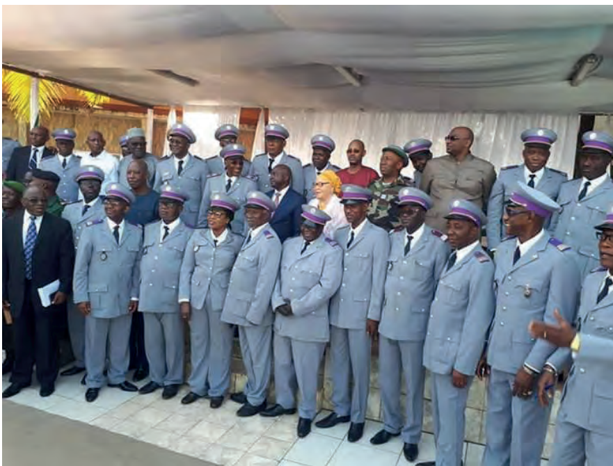
Conférence annuelle des douanes guinéennes lors de la journée Internationale de la Douane

et mettre en œuvre des solutions « automatisées ». Dans la recherche d'un environnement frontalier moins tatillon, où les données sont extraites, partagées et analysées de manière efficace, la douane doit s'appuyer sur des processus automatisés et ne pas négliger l'importance que revêt la réalisation d'études complémentaires en vue d'analyser l'impact des cyber-menaces à la sécurité.