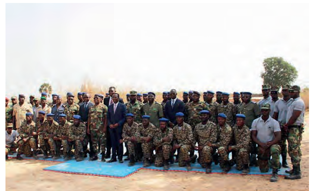
CEREMONIE DE LIBERATION - OTR FORMATION DE LA 1ERE PROMOTION DES AGENTS DE L'UNITE SPECIALE D'INTERVENTION DOUANIERES

Récemment l'OTR (Office Togolais des Recettes) a créé une unité d'élite composée de douaniers dont le nom est USID (Unité Spéciale d'Intervention Douanière) . Ces douaniers formés au combat, seront amenés à lutter contre les trafics en tous genres et à effectuer des missions à risques. Ils pourront participer à des missions d'escorte et de convoyage. Cette unité aura pour caractéristique d'être armée et de pouvoir intervenir sur l'ensemble du territoire national togolais. Cette unité pourra effectuer des tâches de police de sécurité et porter assistance aux enquêteurs. L'évolution de la contrebande au Togo vers une forme de criminalité organisée a amené les autorités togolaises à créer ce type d'unité spéciale. Souhaitons à nos collègues togolais une pleine réussite dans leurs missions à venir.