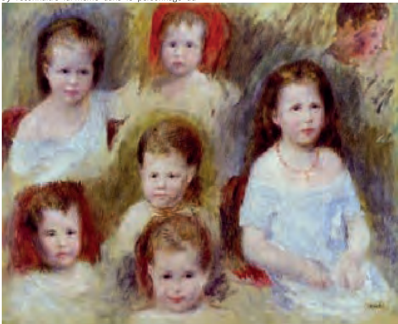
Portraits d'après photos de Marie-Sophie Chocquet (Renoir 1876)