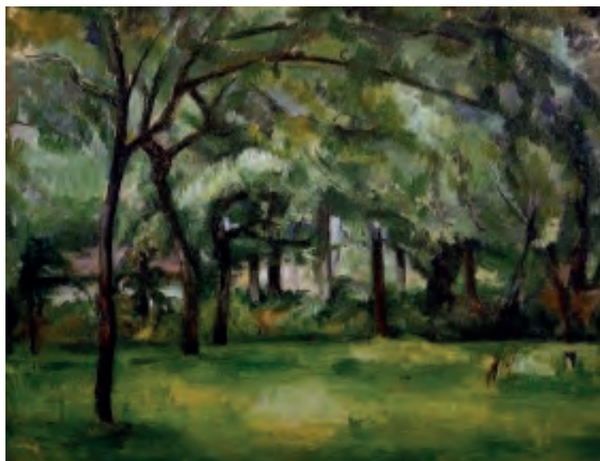
« Ferme normande, été à Hattenville » par Cézanne

sa perception. De la réalité physique de son modèle, il retient la longue silhouette un peu anguleuse. L'identité est effacée au profit d'un allongement des formes (le visage, les mains, les jambes) et d'un jeu sur les variations colorées organisées comme des plans. La couleur prédomine sur le dessin dont traits et limites disparaissent sous la brosse plate et le pinceau de l'artiste. Au total, l'artiste peindra six portraits et plusieurs études au crayon de son ami et mécène. C'est à cette époque (1877) que Victor Chocquet quitte l'administration des douanes afin de se consacrer pleinement à sa passion de collectionneur.