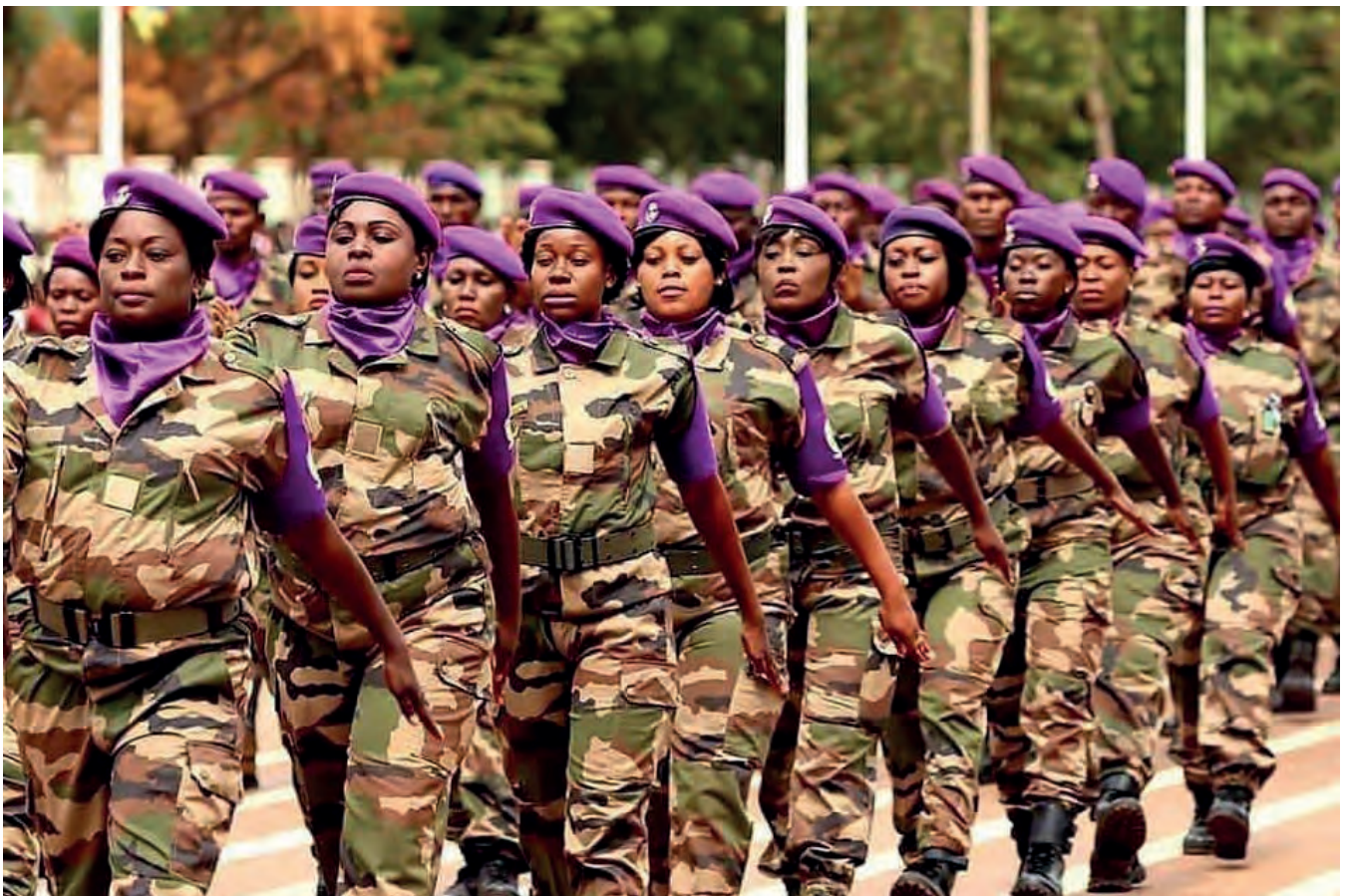
Nos collègues centrafricaines défilant à la Journée Internationale de la Douane

Le concept de frontières SMART met également en évidence le rôle de la douane à l'appui du Programme de développement durable à l'horizon 2030 de l'ONU. En créant des règles du jeu équitables pour toutes les parties prenantes, via des procédures simplifiées, normalisées et harmonisées, il contribue à assurer la